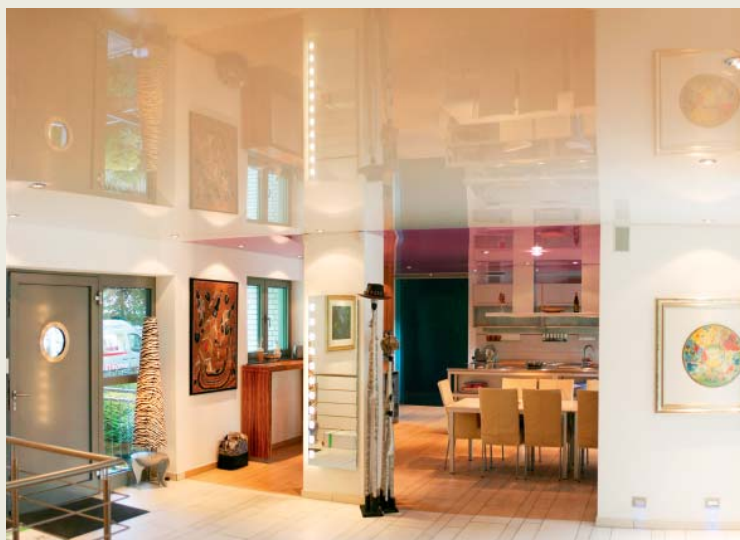
5 Einbaustrahler werden speziell für Spanndecken angeboten und können zu einer anspruchsvollen Lichtplanung beitragen.

ges Leistungsspektrum. Er hat mittlerweile bei einer Reihe von Herstellern die Lizenz zum Spannen erworben und kann daher die Produkte mehrerer Anbieter offerieren.