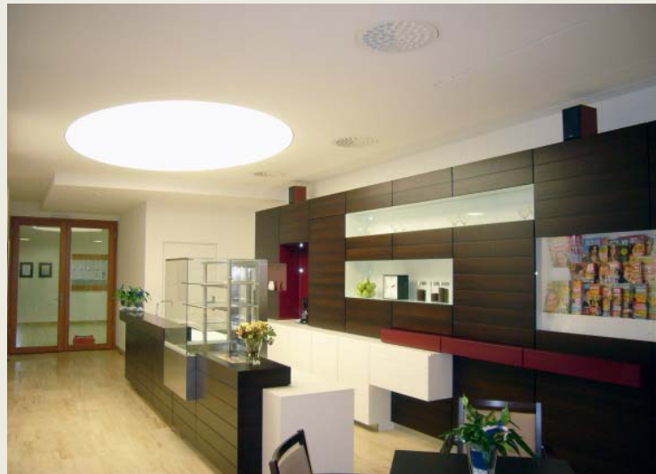
3 Für matte Spanndecken lässt sich der Reflexionsgrad für das Licht vorher bestimmen. In dieser Praxis wurde außerdem ein runder „Lichtkasten“ in die Decke integriert.

Er hat sich auf Aufträge spezialisiert, bei denen gestalterische Vorgaben die künstlerische Kreativität und handwerkliche Umsetzung herausfordern. Höhepunkt seiner Tätigkeit war kürzlich ein Auftrag in Cannes, wo er in einem Hotel gleich sieben Decken eingebaut hat. Auch in den Fernsehsendungen „Jana Ina und Gio-