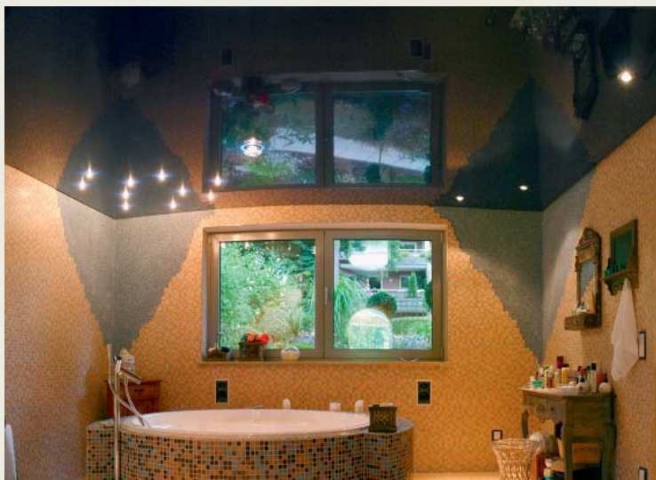
4 Spanndecken können auch Fliesenbeläge noch besser zur Geltung bringen.